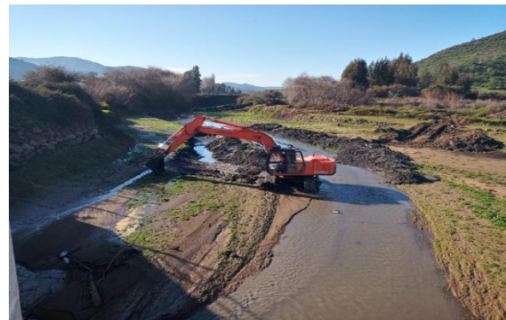
Bocatoma Canal Norte, trabajos de limpieza.

Durante este período, las tareas se centraron en el quehacer del área de operaciones en el cumplimiento por parte de la SC de las actividades de operación y conservación definidas para junio del año 2023 de acuerdo al Plan Anual de Conservación de Obras de agosto del presente año.