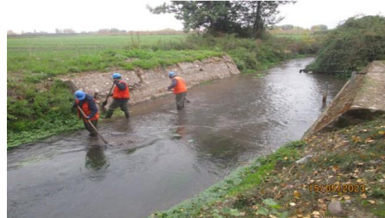
Estación estero Agua Fria. Limpieza por personal de operación de la SC.

Desde principios de mayo a la fecha se realiza limpieza, mantención y reparaciones en la red de riego, con el fin de tener una temporada 2023-2024 sin inconvenientes.