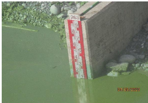
Fecha 04/05/2023,10:45 h. Cota: 262,110 Volumen 102.474.541.

Lectura de Nivel en Embalse Convento Viejo.