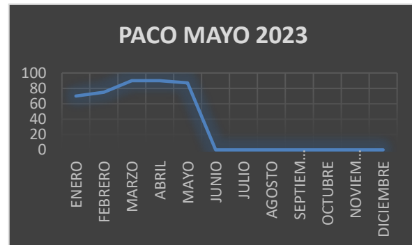
Gráfico de cumplimiento del PACO 2023, correspondiente al mes de mayo 2023.