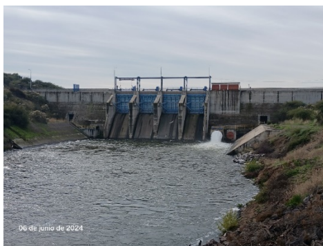
Fecha 06/06/2024. Vista general y funcionamiento de la válvula How-Bunger