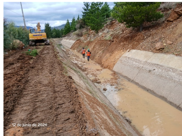
Canal Sur, km 3+500.

Durante junio la concesionaria ha trabajado intensamente en el río preparando la fundación del tramo que se llevó el río durante los temporales del 2023 de la barrera fija y en la reconstrucción del pretil fusible.