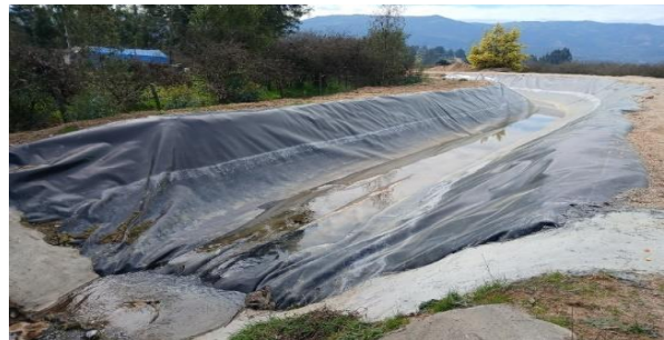
Imagen N°7. Canal Norte, km 21+305 al km 21+360. Vista de tramo con lámina geomembrana.

Se terminó la recuperación de la Barrera en el río Teno, sector de la Bocatoma del canal Teno – Chimbarongo. La Sociedad Concesionaria ha trabajado intensamente en el río reponiendo y mejorando el tramo que se llevó el río durante los temporales del 2023 de la barrera fija.