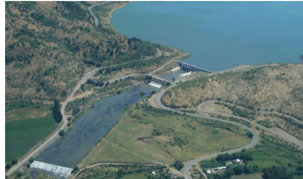
Imagen N°1. Panorámica de Presa Auxiliar de Embalse y Estero Chimbarongo.

El proyecto concesionado, se ubica a 160 km al sur de Santiago, en la cuenca del Estero Chimbarongo.