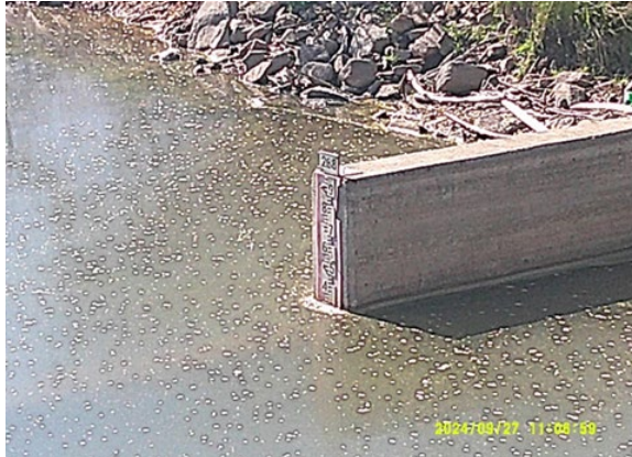
Imagen N°5. volumen de 218.121.592. millones de m 3 . Fecha 27/09/2024.