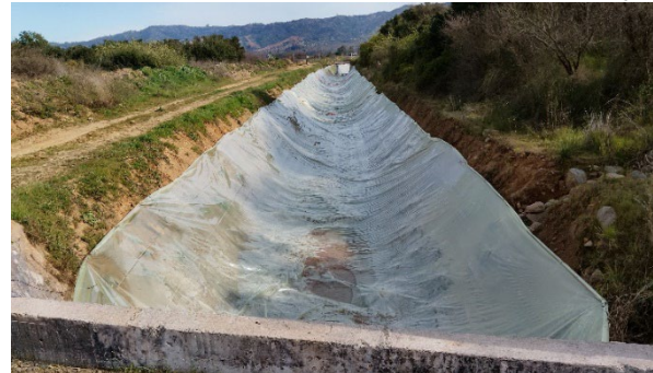
Imagen N°7. Canal Norte, km 15+720. Colocación de polietileno, solución provisoria a filtraciones detectadas.

La Sociedad Concesionaria ha trabajado intensamente en el río reponiendo y mejorando el tramo que se llevó el río durante los temporales del 2023 de la barrera fija.