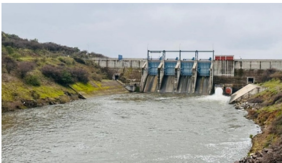
Imagen N°3. Vista general y funcionamiento de la válvula de entrega a riego Howell-Bunger.