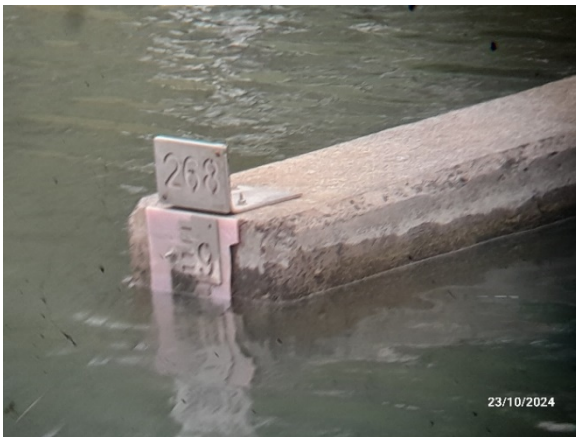
Imagen N°5. volumen de: 233.912.998. millones de m 3 . Fecha 23/10/2024.