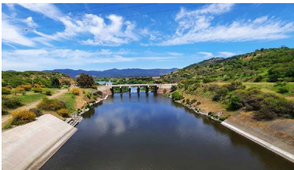
Imagen N°2. Vista general agua abajo desde la Presa Auxiliar.

Mediante la Resolución (E) N° 1722, de fecha 07 de septiembre de 2020, se materializa la Puesta en Servicio Definitiva de las Fases I, II y III.