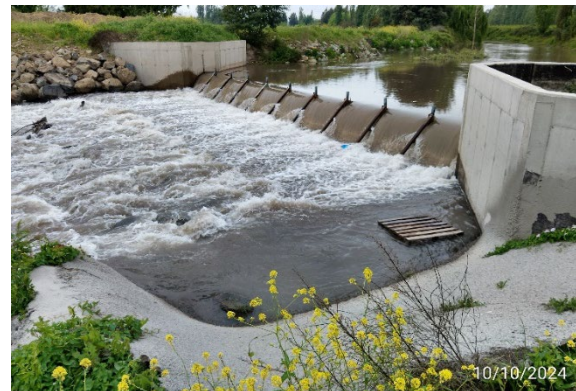
Imagen N°7. Canal Norte, km 15+720. Colocación de polietileno, solución provisoria a filtraciones detectadas.

Red de Riego: durante el mes de octubre 2024, el sistema de regadío está operativo desde septiembre, regulando el caudal según las necesidades de los usuarios. La Sociedad Concesionaria intensifica el control de aforos en varias estaciones, con seguimiento de la Inspección Fiscal para mantener las áreas libres de obstrucciones. En el Canal Norte Unificado, se realizan reparaciones en el kilómetro 12+000, monitoreando la estabilización topográfica del terreno. También se protegen superficies con polietileno para prevenir daños en caso de lluvias inesperadas.