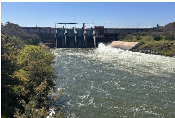
Imagen N°3. Vista general y funcionamiento de la válvula de entrega a riego Howell-Bunger.