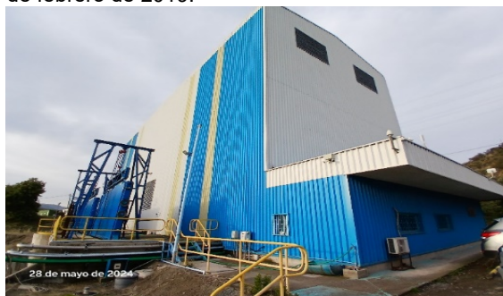
Imagen N°4. Vista general de la Central Hidroeléctrica.

El artículo 1.10.2.2 de las Bases de Licitación dispone que el concesionario podrá ofrecer servicios de venta de energía eléctrica, tal que la producción sea compatible con los servicios señalados en las Bases de Licitación y cumpla con la legislación vigente relacionada con la materia. De acuerdo con esta norma, la concesionaria desarrolló un proyecto eléctrico que consistió en la construcción de una Central Hidroeléctrica a pie de presa, de una potencia nominal de 16,4 MW, formada por dos turbinas Kaplán, cuyas obras se encuentran terminadas y en operación oficial desde febrero de 2019 según autorización del CEN, carta DE 01459-19) desde el 21 de febrero de 2019.