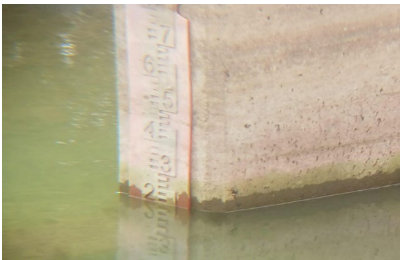
Imagen N°5. volumen de: 214.220.747. millones de m 3 . Fecha 17/12/2024.