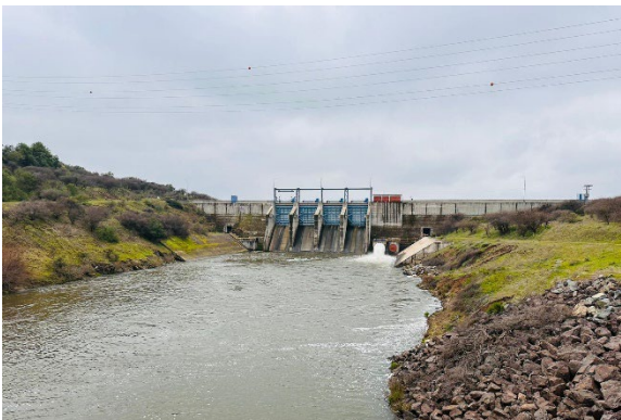
Imagen N°3. Vista general y funcionamiento de la válvula de entrega a riego Howell-Bunger.