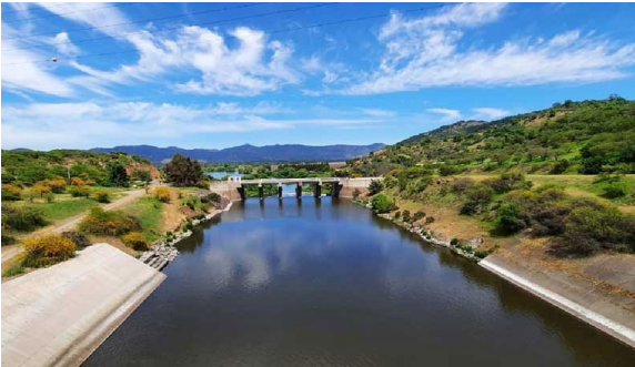
Imagen N°2. Vista general agua abajo desde la Presa Auxiliar.

Mediante la Resolución (E) N° 1722, de fecha 07 de septiembre de 2020, se materializa la Puesta en Servicio Definitiva de las Fases I, II y III.