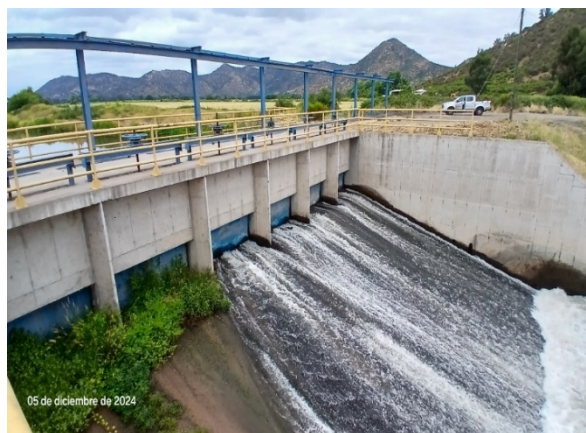
Imagen N°7. Bocatomas Las Toscas. Vista de compuertas inicio Canal Matriz Nilahue Tramo 2.

Red de Riego: Durante el mes de diciembre 2024, el sistema de regadío está operativo desde septiembre, regulando el caudal según las necesidades de los usuarios. La Sociedad Concesionaria intensifica el control de aforos en varias estaciones, con seguimiento de la Inspección Fiscal para mantener las áreas libres de obstrucciones. En el Canal Norte Unificado del kilómetro 12+000 se concluyeron las reparaciones de manera provisoria, con la continuación del monitoreo topográfico de la estabilización del terreno. Sin embargo, se requiere continuar en lo que resta del servicio el cuidado permanente del sistema.