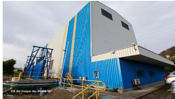
Imagen N°4. Vista general de la Central Hidroeléctrica.

El artículo 1.10.2.2 de las Bases de Licitación dispone que el concesionario podrá ofrecer servicios de venta de energía eléctrica, tal que la producción sea compatible con los servicios señalados en las Bases de Licitación y cumpla con la legislación vigente relacionada con la materia. De acuerdo con esta norma, la concesionaria desarrolló un proyecto eléctrico que consistió en la construcción de una Central Hidroeléctrica a pie de presa, de una potencia nominal de 16,4 MW, formada por dos turbinas Kaplan, cuyas obras se encuentran terminadas y en operación oficial desde febrero de 2019 según autorización del CEN, carta DE 01459-19) desde el 21 de febrero de 2019.