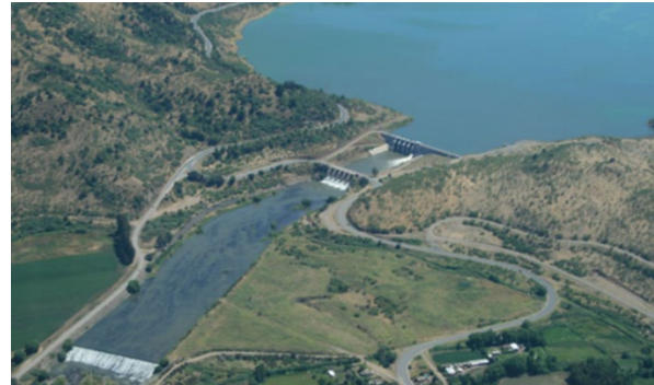
Imagen N°1. Panorámica de Presa Auxiliar de Embalse y Estero Chimbarongo.

El proyecto concesionado, se ubica a 160 km al sur de Santiago, en la cuenca del Estero Chimbarongo.