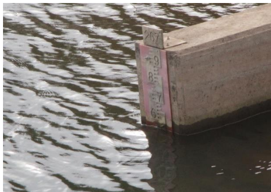
Fecha 14/02/2024, 10:40 h. Cota: 266,54 Volumen 196.467.866 m3.

Lectura de Nivel en Embalse Convento Viejo.