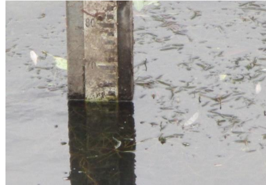
Fecha 22/02/2024, 10:44 h. Altura limnimétrica: 0,64 m. Caudal: 28,311 m 3 /s.

Estación de medición Tipo 1 Estación Lo Toro.