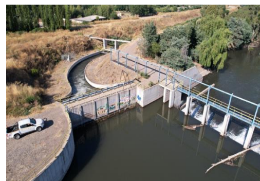
Bocatoma Las Toscas. Compuertas de admisión Canal Matriz Nilahue tramo 1 en normal funcionamiento.

La Concesionaria continuó con los preparativos necesarios para la reconstrucción del pretil fusible de la Barrera Teno, destruida por los temporales del año 2023.