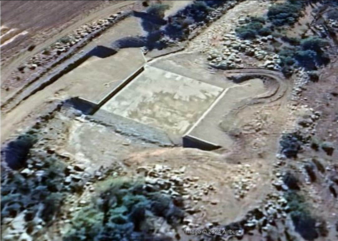
Fig.5, Vista estación de control Las Carditas