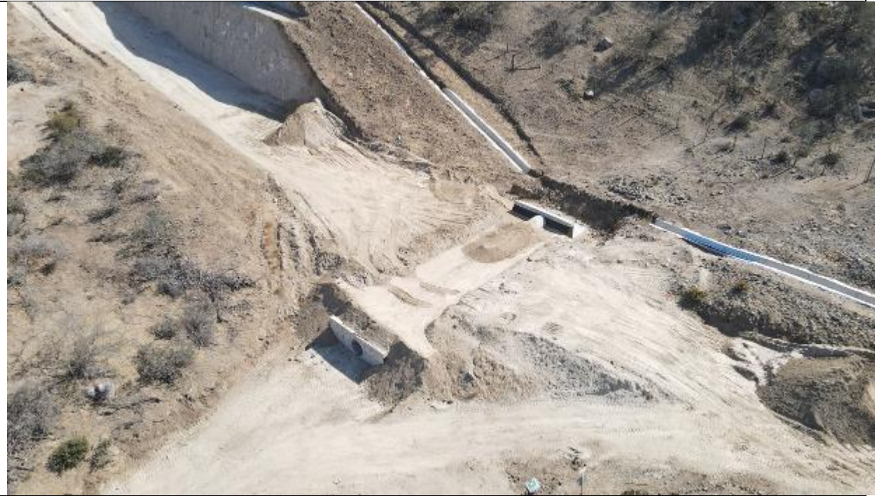
Fig. 2, Rellenos estructurales OA N° 21. Variante Ruta E315