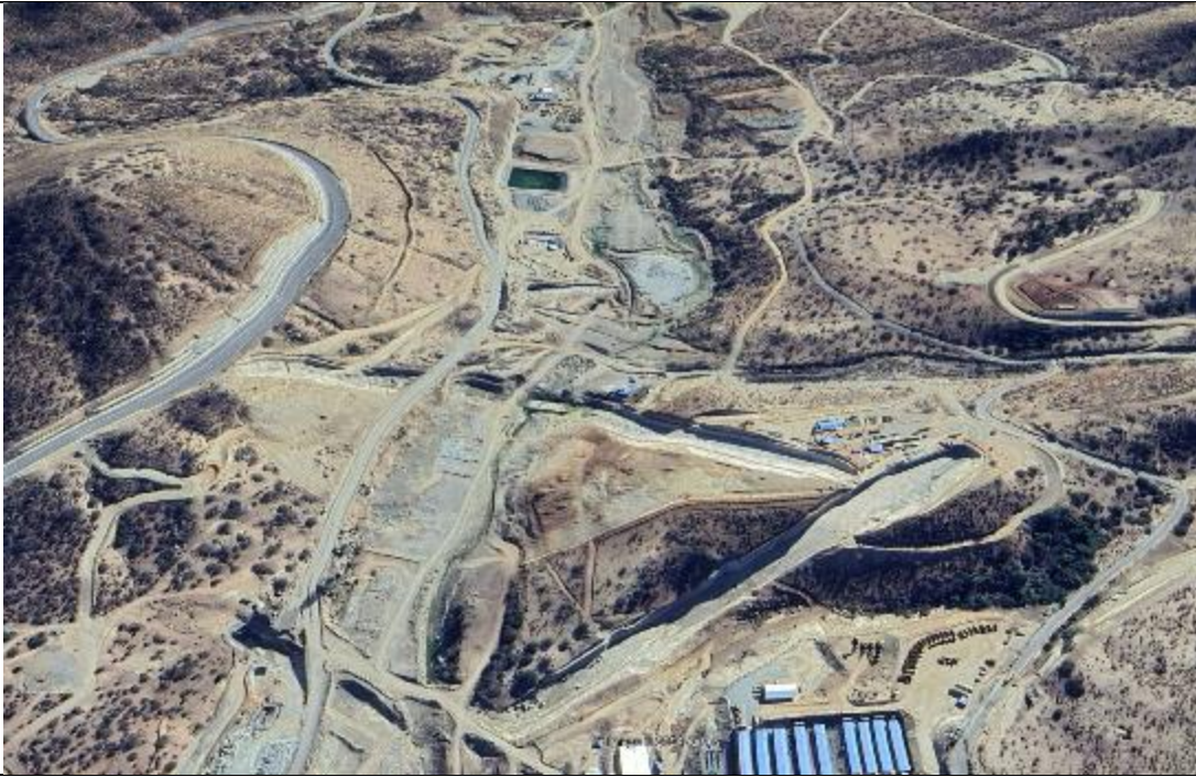
Fig.4, Vista estación de control Frutillar