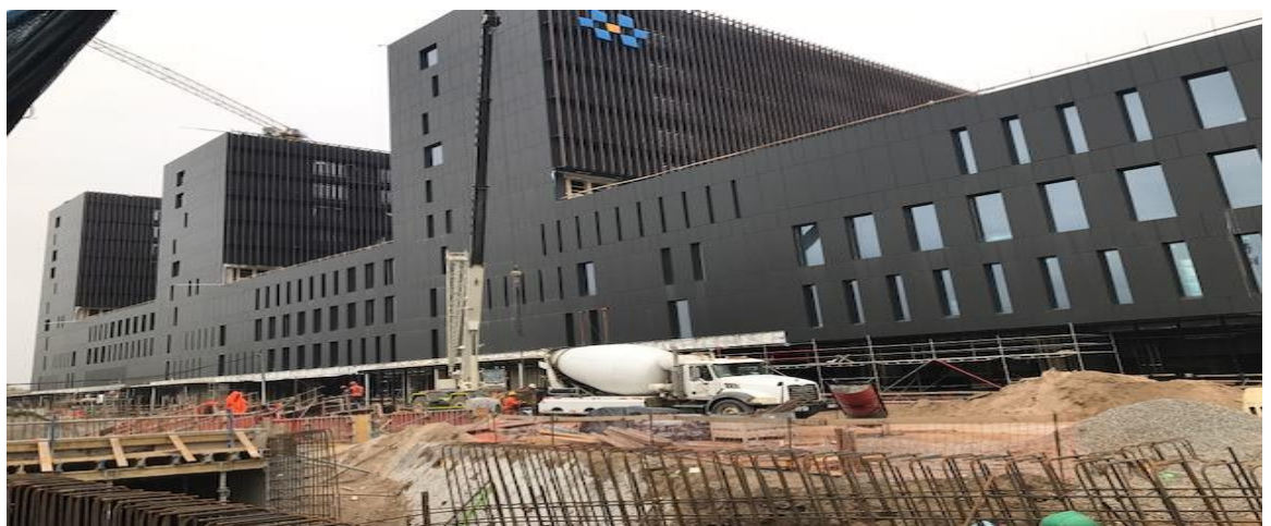
Vista general fachada poniente de la obra