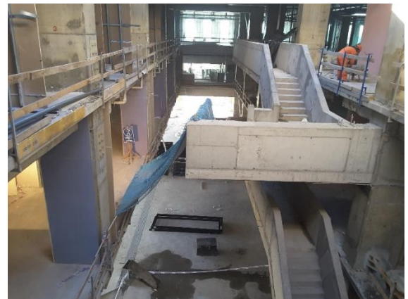
Avance en escaleras