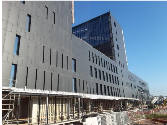
Vista fachada oriente