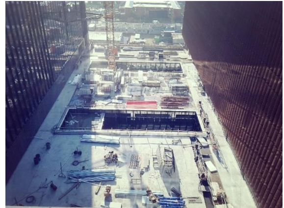
Vista patios interiores