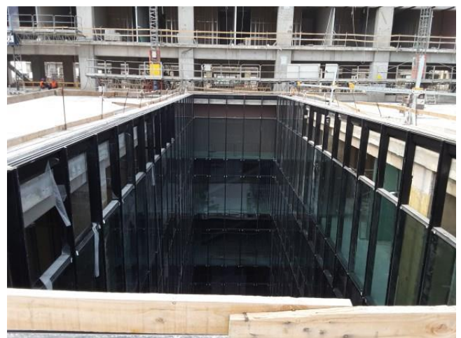
Avance de instalación de muro cortina en patios interiores.