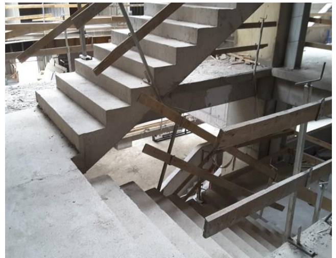
Avance de instalaciones de escaleras prefabricadas.