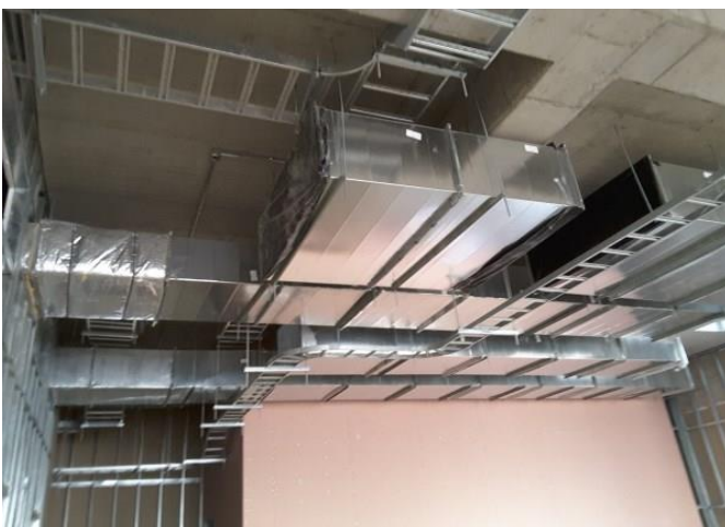
Avance de instalaciones.