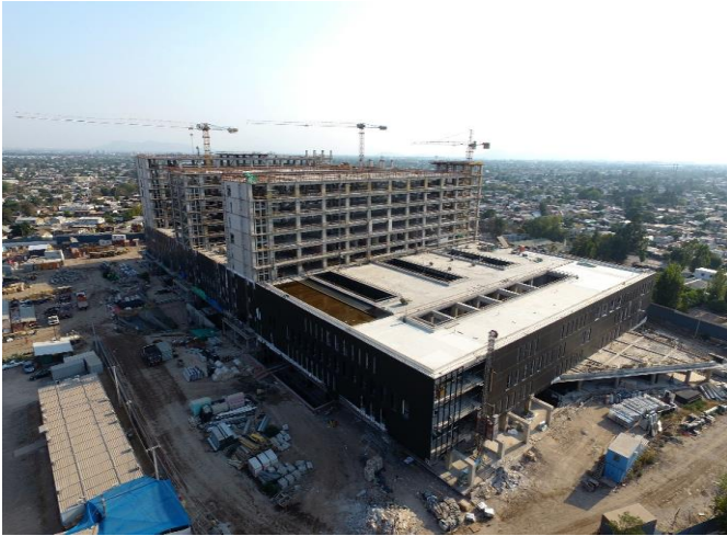
Vista general fachada nor-oriente.