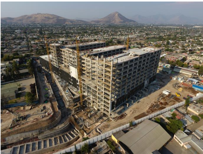
Vista general fachada sur-poniente.