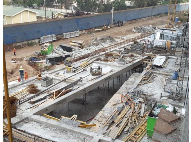
Avance de rampa de acceso.