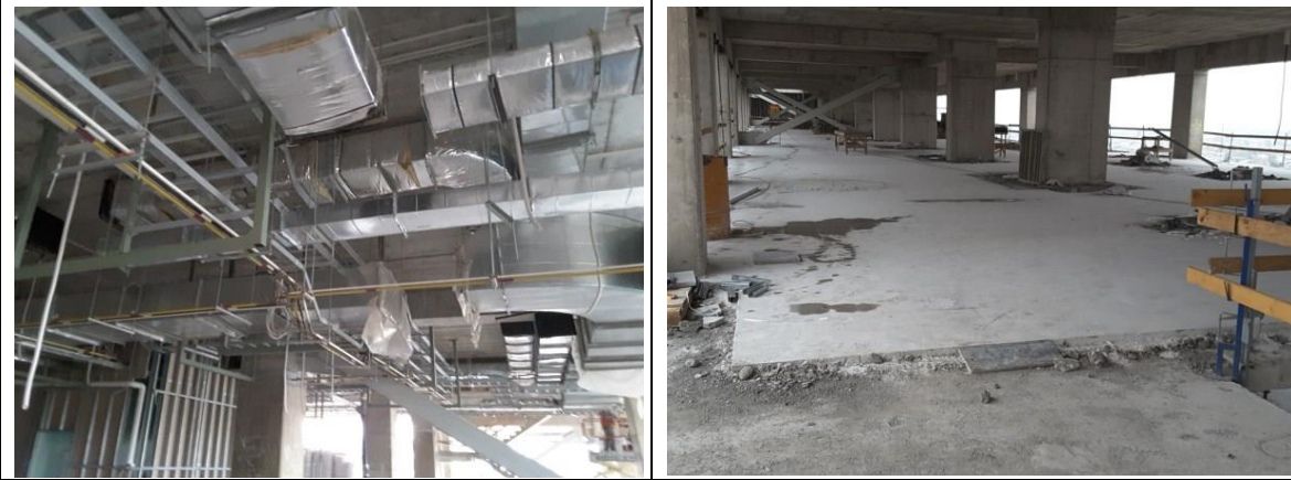
Avance en instalaciones de soportes y ductos de clima