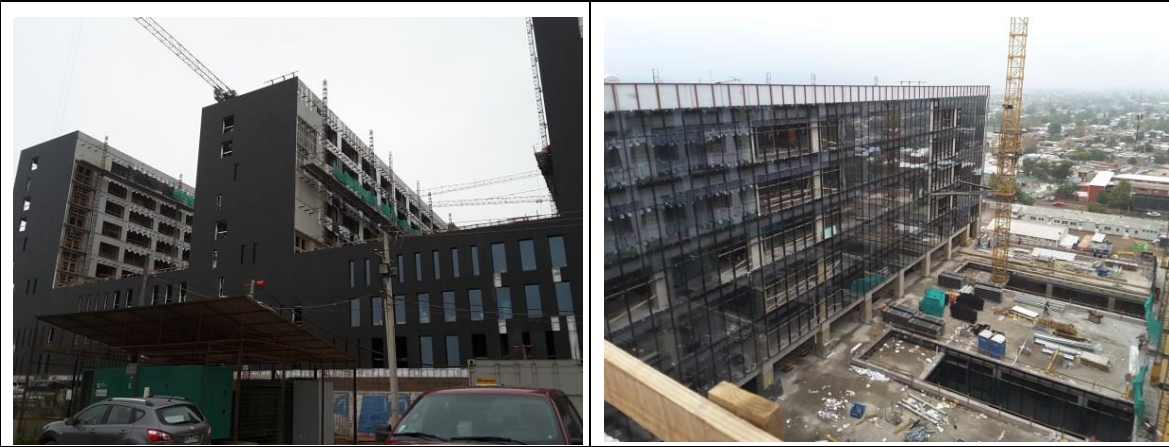
Vista fachada oriente