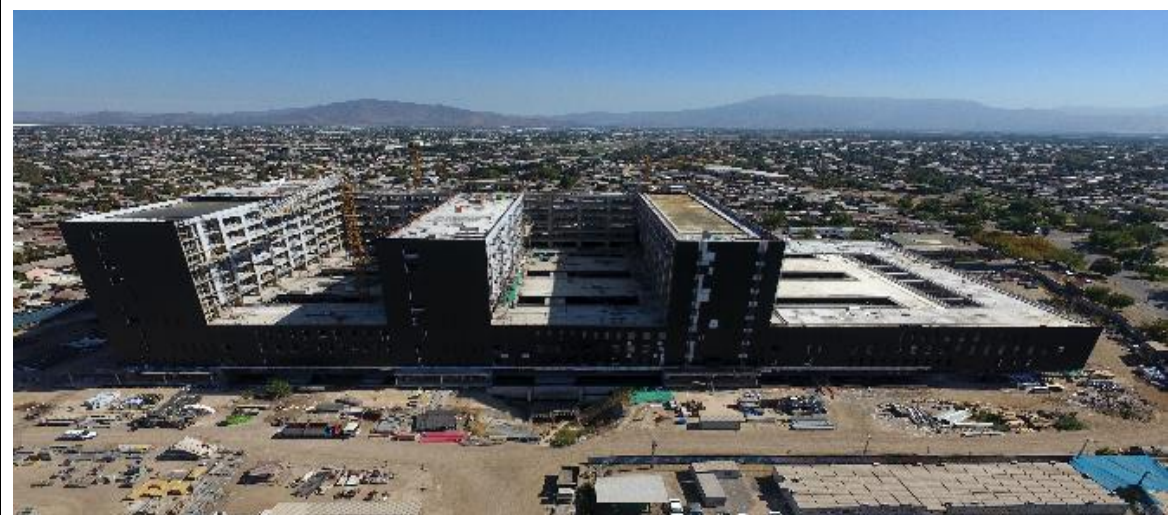
Vista general fachada oriente de la obra