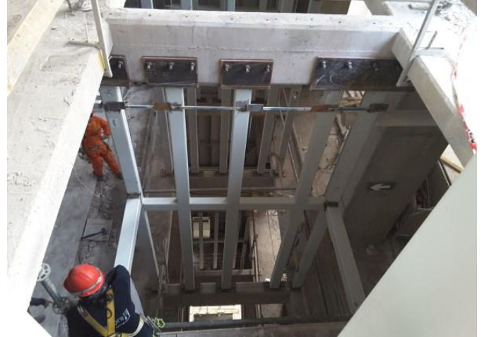
Avance de cajas de ascensores.