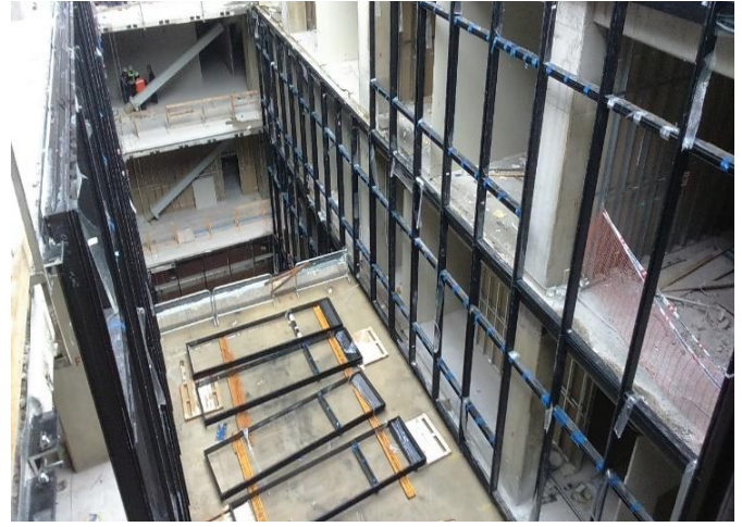
Avance de instalación de estructuras de muro cortina en patios interiores.