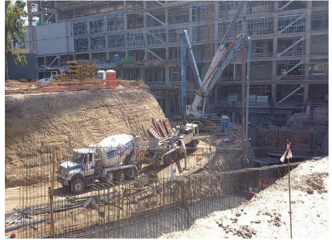
Avance de rampa de acceso calle Galvarino.