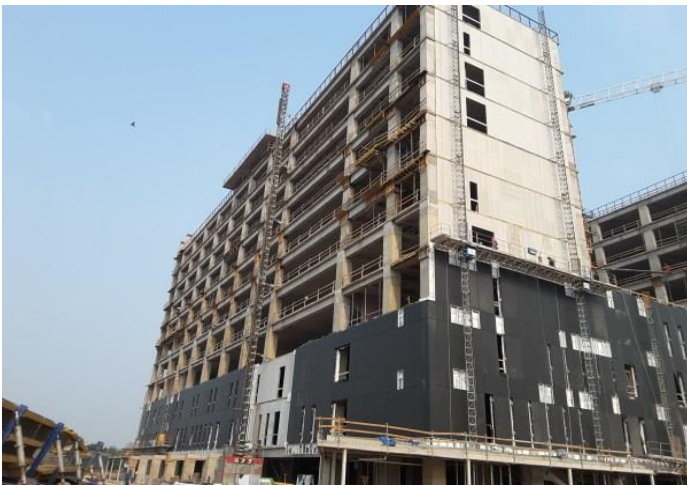
Vista fachada sur-oriente torre C.