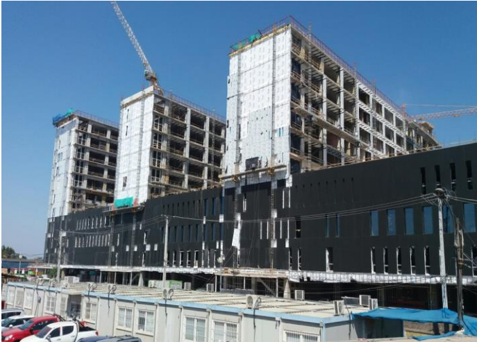
Vista general fachada oriente torres A, B y C.