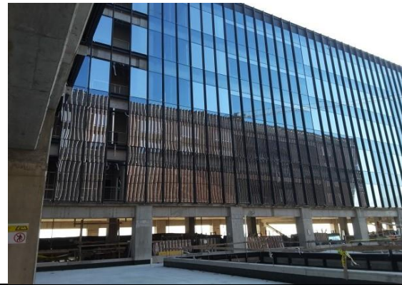
Vista patios interiores