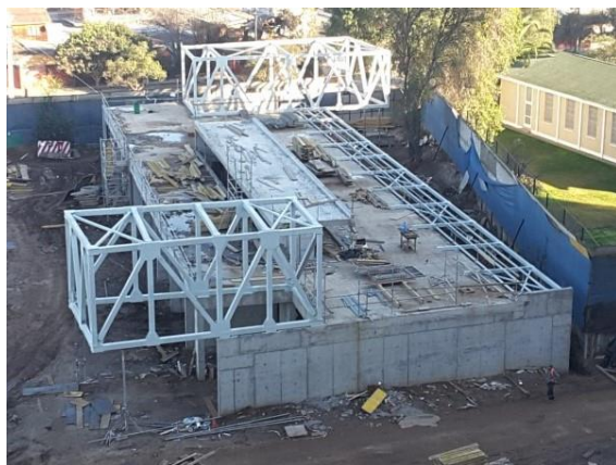
Avance en obras de sala cuna