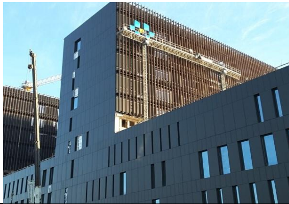
Vista fachada oriente