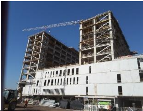
Vista fachada oriente