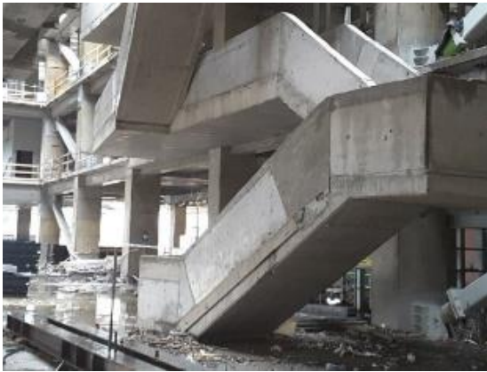
Avance en instalación de escaleras prefabricadas