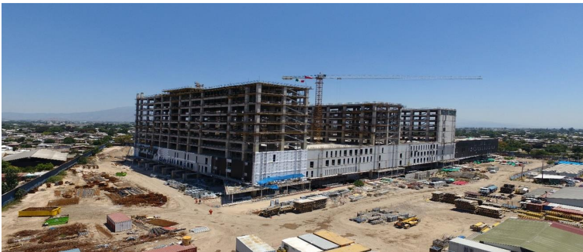
Vista sur oriente de la obra