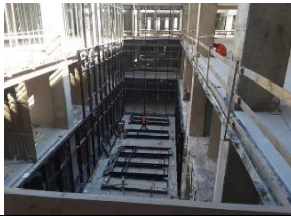
Vista patios interiores