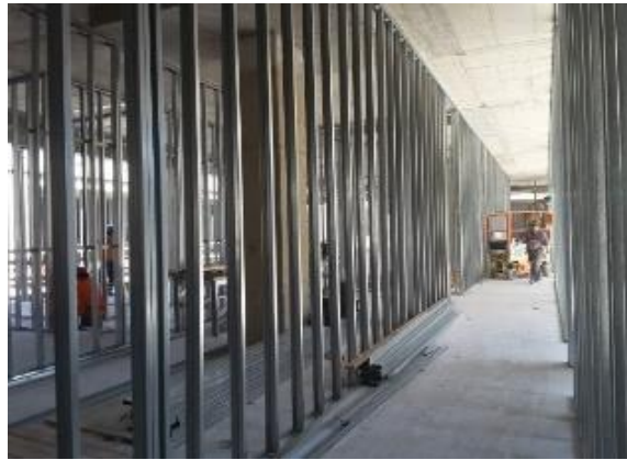
Avance en instalación de tabiquería