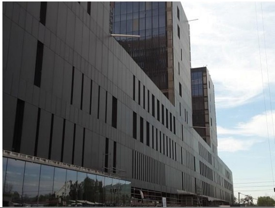
Vista fachada oriente