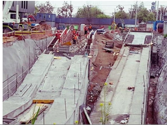
Rampas de acceso oriente