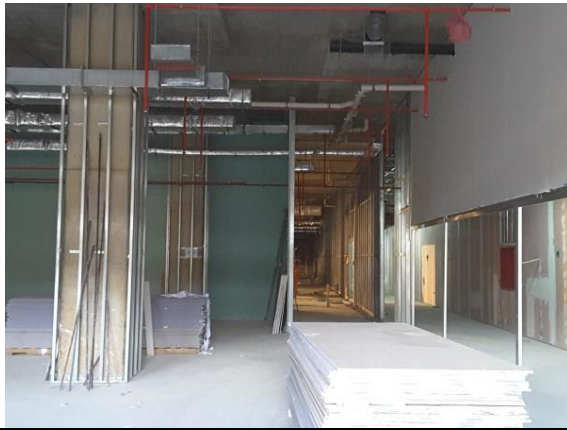
Avance en tabiquería e instalaciones