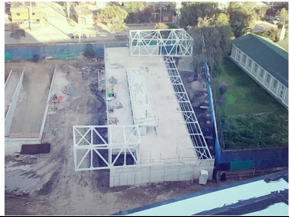
Avance en Sala Cuna