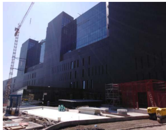
Vista fachada sector poniente