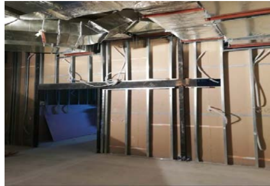
Avances tabiquería y estructura soportación puerta automática.