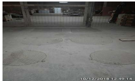
Planta Elevadora de Aguas Servidas