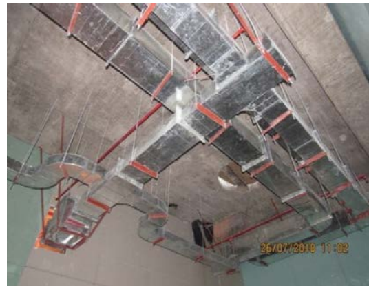
Avance en Instalaciones de Climatización