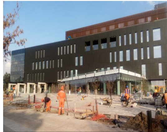
Vista fachada norte