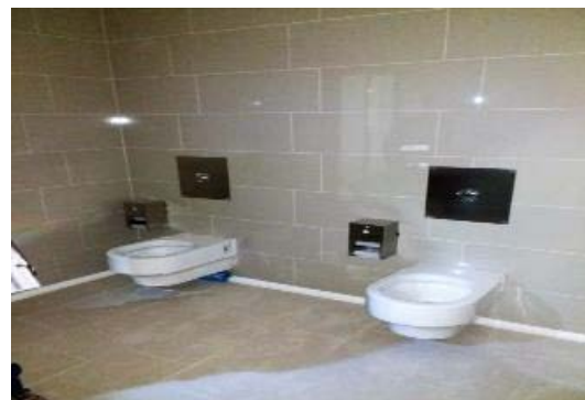
Artefactos sanitarios en Unidad de Farmacia