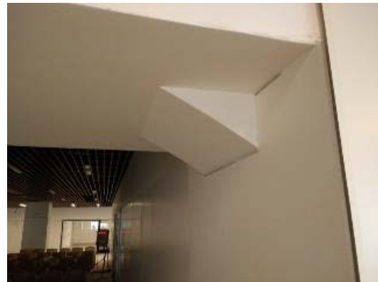
Avance en instalaciones en Admisión