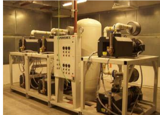
Avance Sala de Máquinas