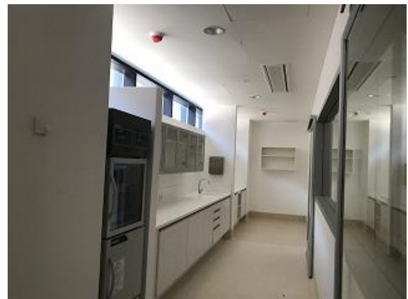
Avance en estaciones de enfermería