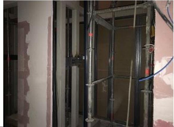
Avance en instalación de ascensores