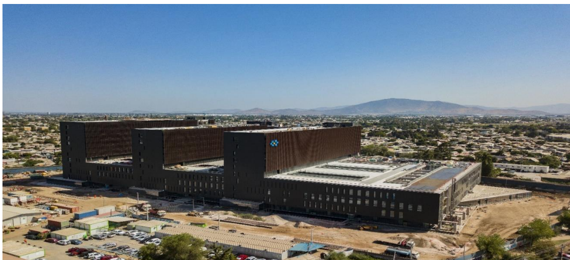
Vista nor oriente de la obra