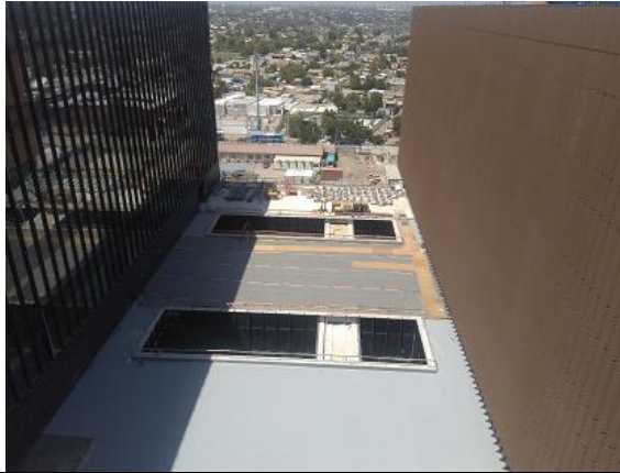
Vista patios interiores