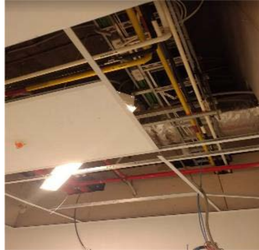
Cielo modular faltante