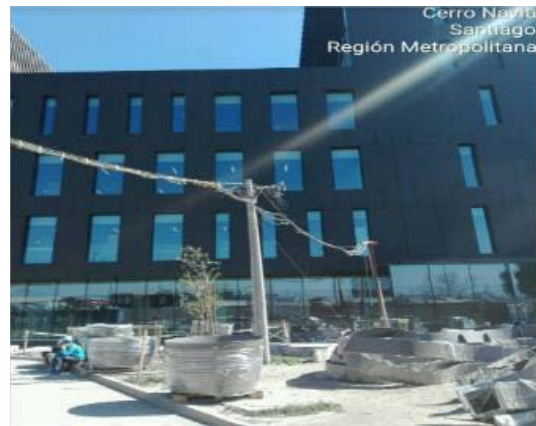
Empalmes provisionarios operativos