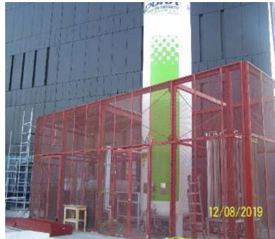
Instalación tanque de oxígeno líquido