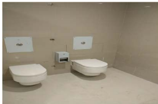
Instalaciones de artefactos sanitarios