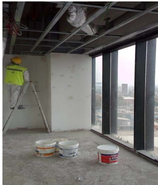
Recintos sin terminar