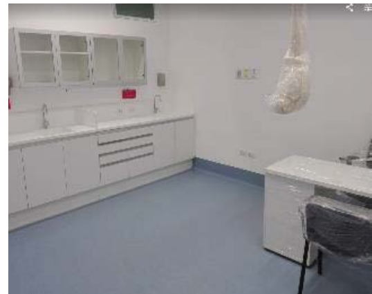
Avance Sala de Procedimientos.