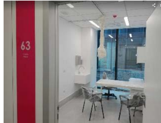
Avance en consultas médicas.