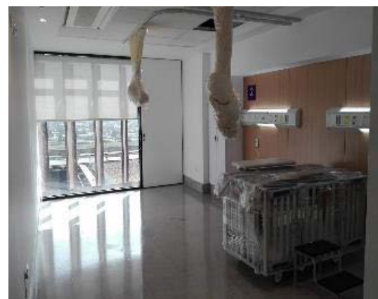
Avances Salas de Hospitalización.