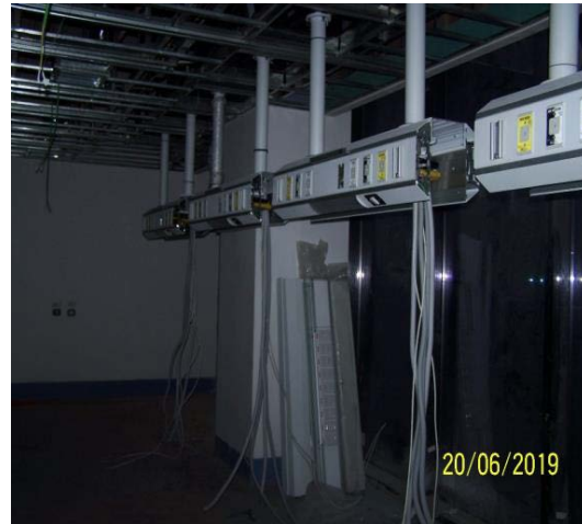
Avance recintos de Urgencia Infantil