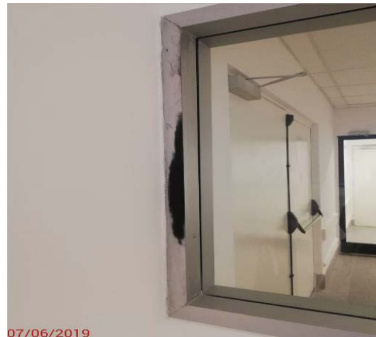
Inspección a terminaciones