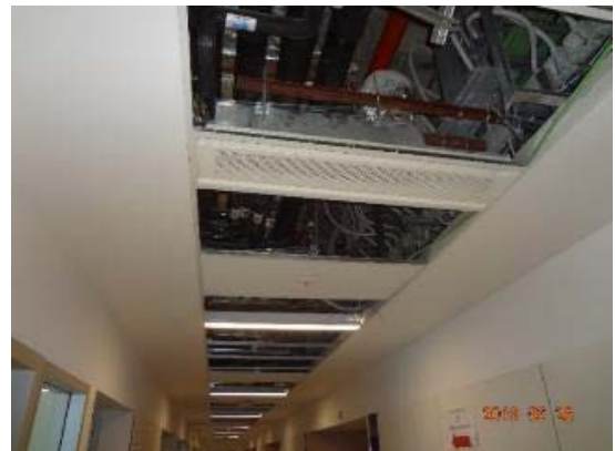
Cielo modular faltante en los pasillos