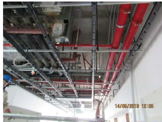
En proceso de instalación de cielo falso