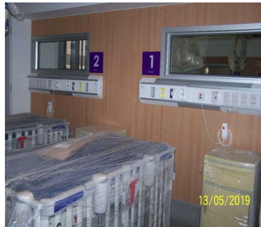
Avance en Instalaciones Unidades Aisladas