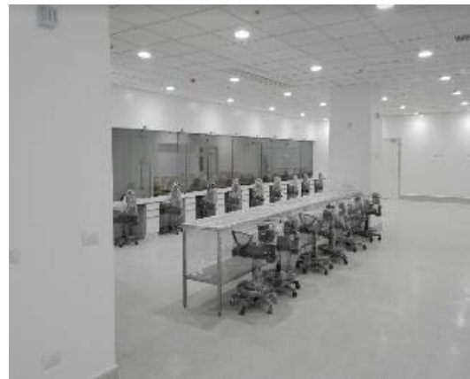
Farmacia Piso 1