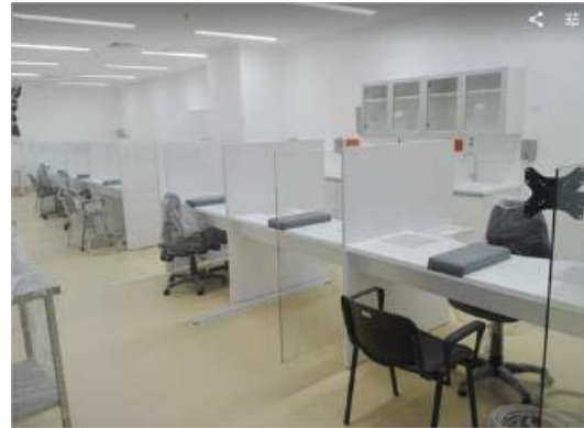
Sala de procedimientos toma de muestras.