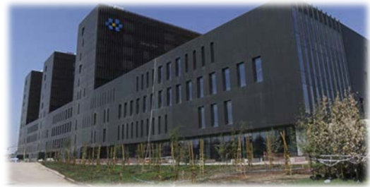
Hospital Félix Bulnes