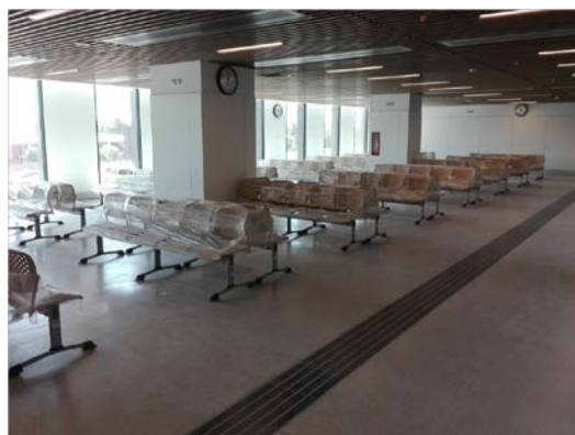
Sala de Espera Procedimientos