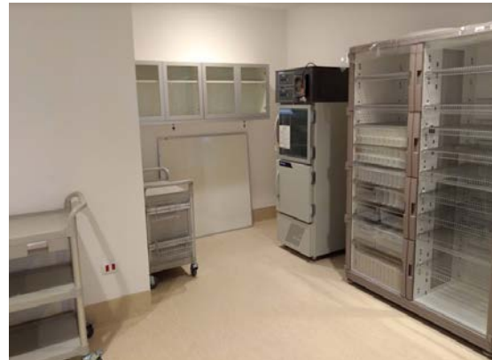
Equipos de Laboratorio