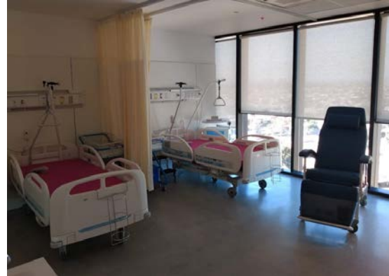
Salas de hospitalizaciones