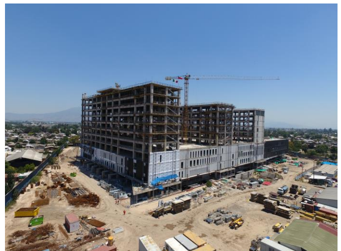
Vista general fachada sur-oriente.

Respecto al avance constructivo de la obra, las imágenes muestran faenas representativas del desarrollo del mes.