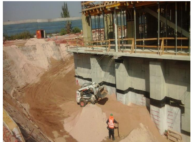
Ejecución de rellenos en eje A3 (21-23a)