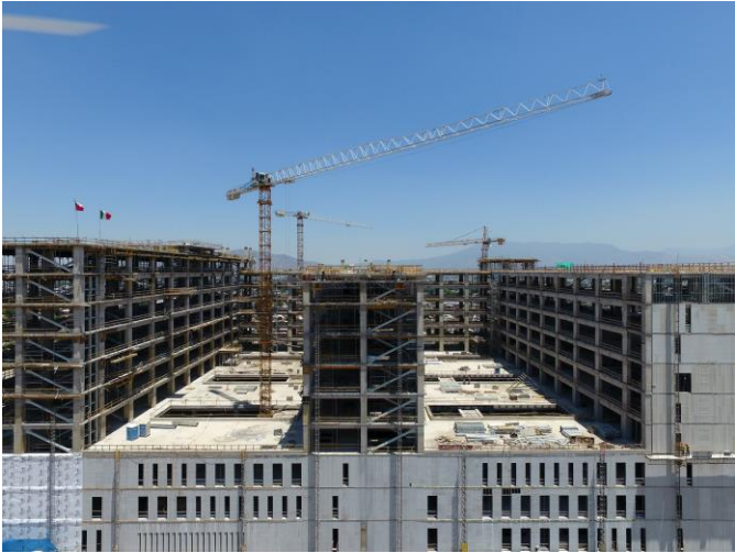
Vista en altura de las torres A, B y C (helipuerto).