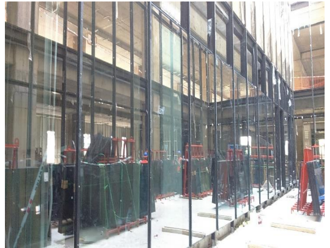
Avance de instalación de muro cortina en patios interiores.