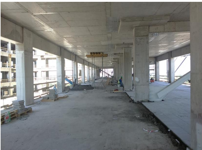
Instalación de pavimentos en piso 7.