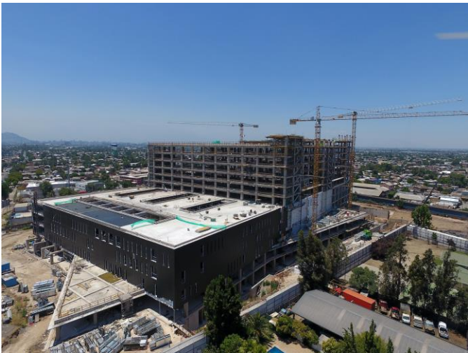
Vista general fachada nor-poniente.