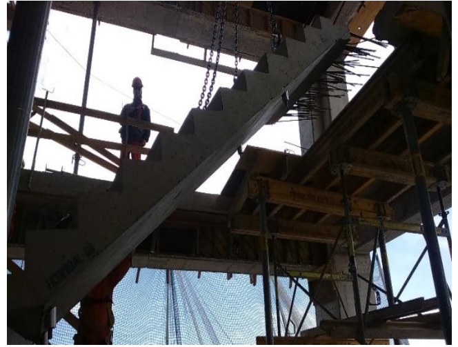
Avance de instalaciones de escaleras prefabricadas.