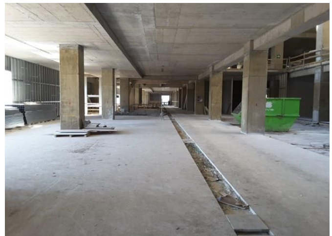
Avance de pavimentos