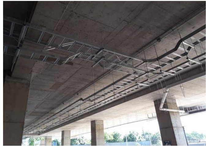
Avance de instalaciones.