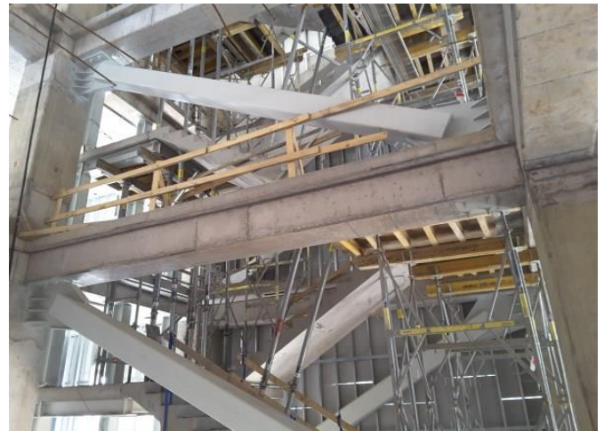
Instalación de riostras y escaleras.