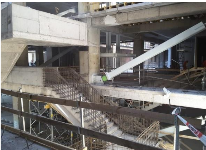
Avance de construcción de escaleras.