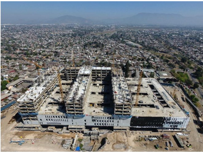
Vista general fachada oriente.