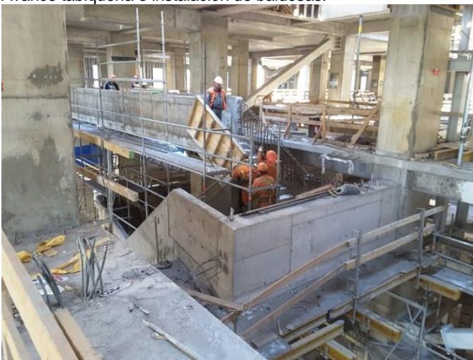
Avance de construcción de escaleras.