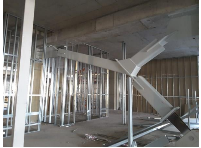
Instalación de Riostras.