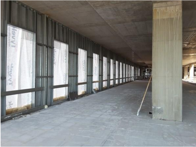
Avance tabiquería e instalación de baldosas.