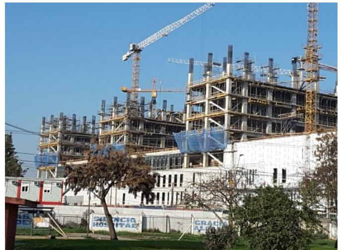
Vista general fachada oriente.

Respecto al avance constructivo de la obra, las imágenes muestran faenas representativas del desarrollo del mes.