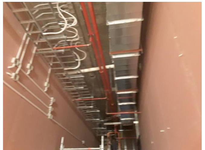
Avance de instalaciones.