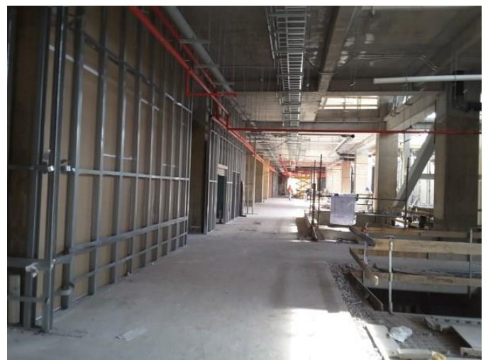
Avance de instalaciones.