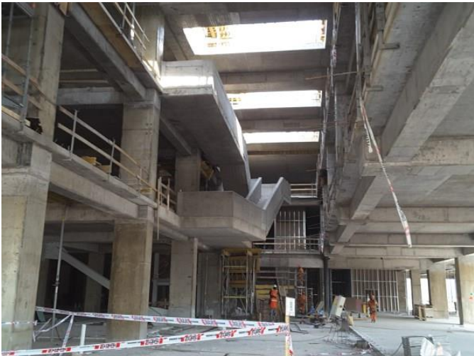
Avance de construcción de escaleras.