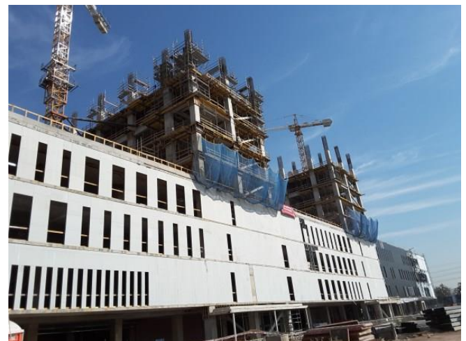
Vista general fachada oriente.

Respecto al avance constructivo de la obra, las imágenes muestran faenas representativas del desarrollo del mes.