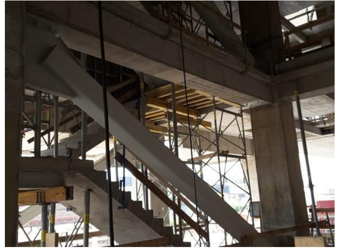
Instalación de riostras y escaleras.