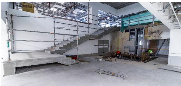
Primer piso ING