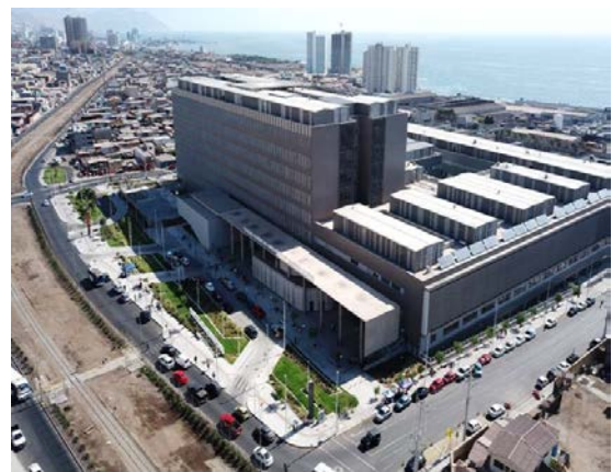
Hospital de Antofagasta