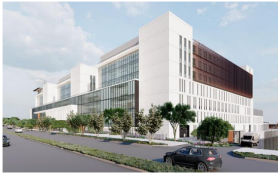
Avance proyecto definitivo