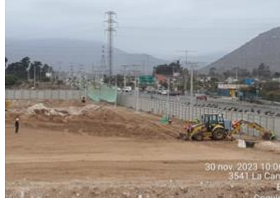
Maniobras de escarpe (Inicio de obras preliminares que establece el Art. 1.9.1)