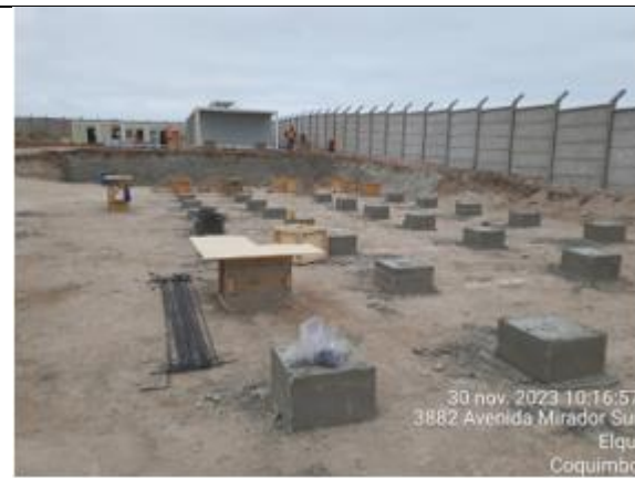
Fundaciones para estructuras de barreras acústicas. (Inicio de obras preliminares que establece el Art. 1.9.1)