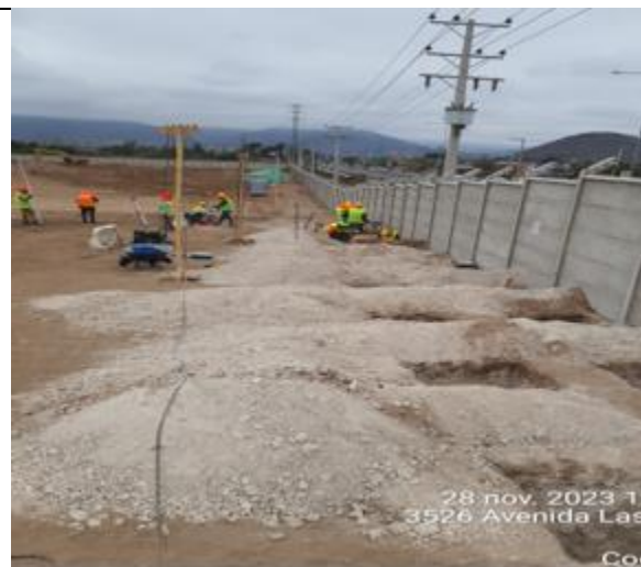
Ejecución barreras acústicas y material particulado (Inicio de obras preliminares que establece el Art. 1.9.1)