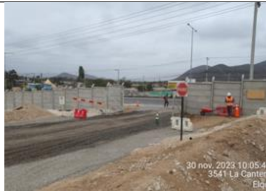
Obras de mitigación para el uso de la vía destinada al ingreso y salida de camiones (Inicio de obras preliminares que establece el Art. 1.9.1)