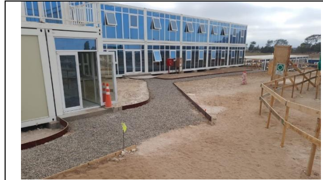
Avance de oficinas de Instalaciones de Faena