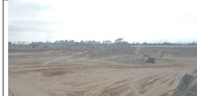
Módulos de Instalaciones de Faenas. (Obras preliminares que establece el Art. 1.9.1)