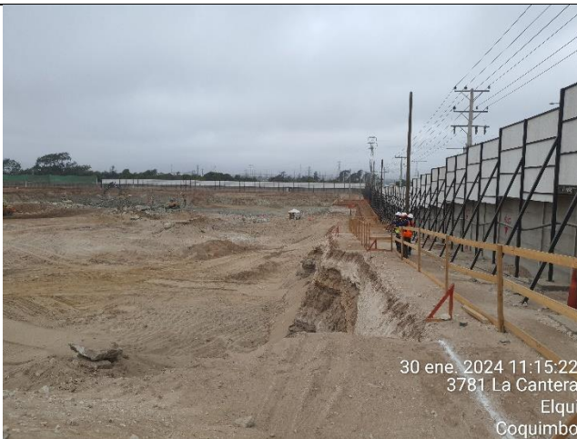
Ejecución excavaciones masivas y barreras de mitigación de ruido (Obras preliminares que establece el Art. 1.9.1)