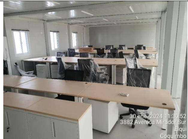
Módulos de Instalaciones de Faenas. (Obras preliminares que establece el Art. 1.9.1)