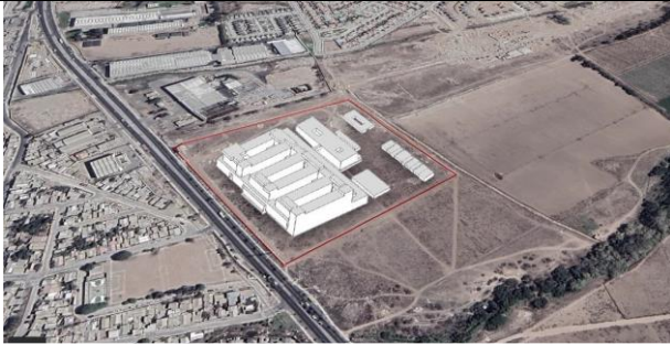
Avance proyecto definitivo en emplazamiento hospital