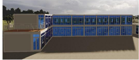
Propuesta de oficinas de Instalaciones de Faena aprobada por Inspección Fiscal.