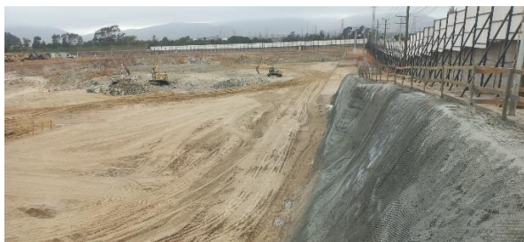
Ejecución excavaciones masivas y mitigaciones acústica