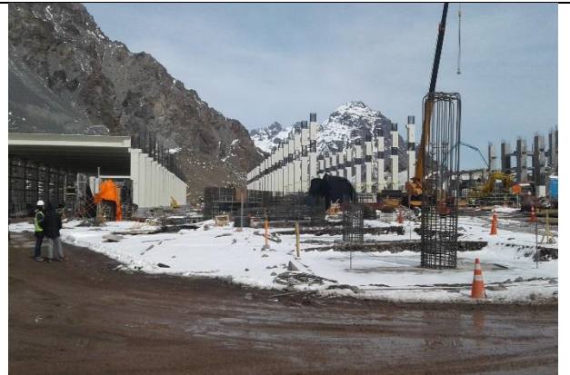
Estructura – Edificio de Control