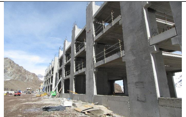
Estructura – Edificio de Alojamiento