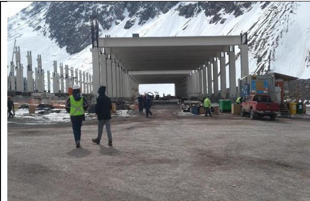
Estructura - Edificio de Control