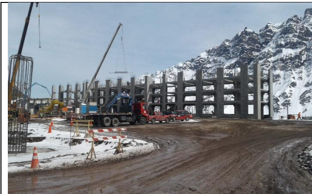
Estructura – Edificio de Alojamiento