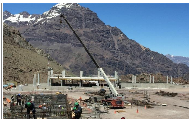
Estructuras – Edificio de Carabineros