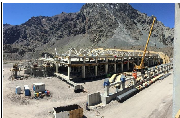
Estructuras – Edificio de Control y Servicios