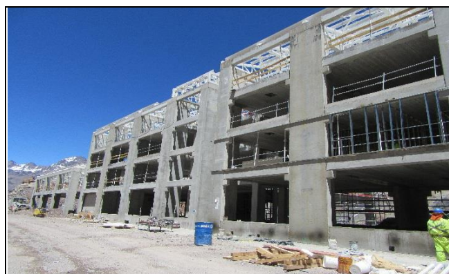
Estructura con techumbre parcial – Edificio de Alojamiento