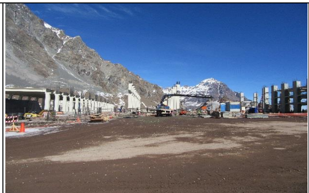
Panorámica - Edificios de Control y de Alojamiento