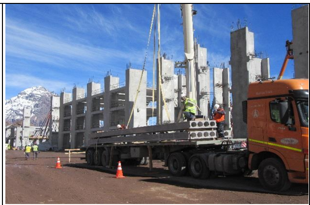
Montaje de vigas - Edificio de Alojamiento