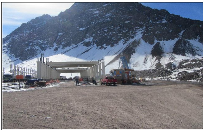
Estructura - Edificio de Control