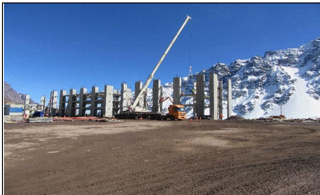
Estructura – Edificio de Alojamiento