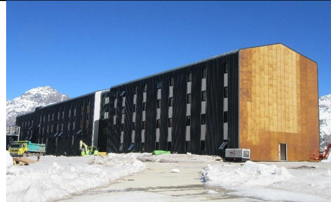
Edificio de Alojamiento