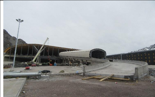
Edificio de Control – Vista norte