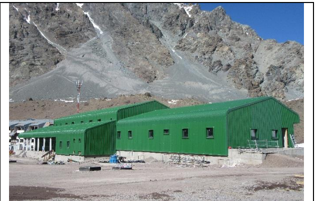
Edificio de Carabineros