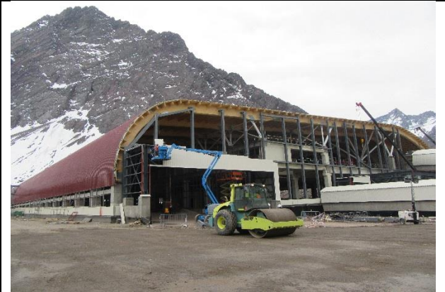
Edificio de Control – Vista sur