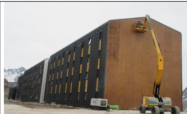
Edificio de Alojamiento