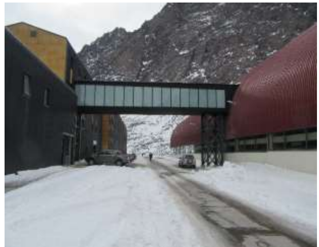
Edificio de Alojamiento y conexión a Edificio de Control y Servicios