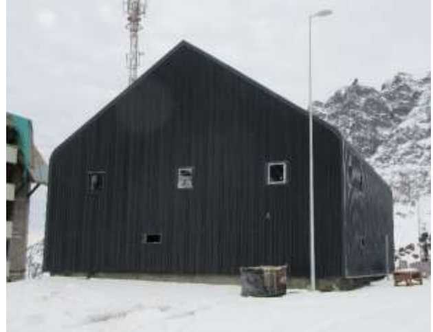
Edificio de Administración de la Sociedad Concesionaria