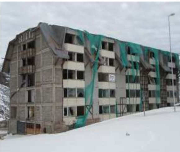
Demolición Edificio Tangerini