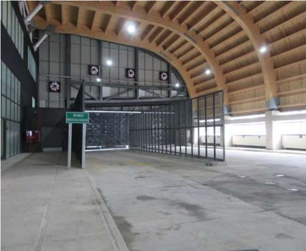
Edificio de Control y Servicios Zona de Buses