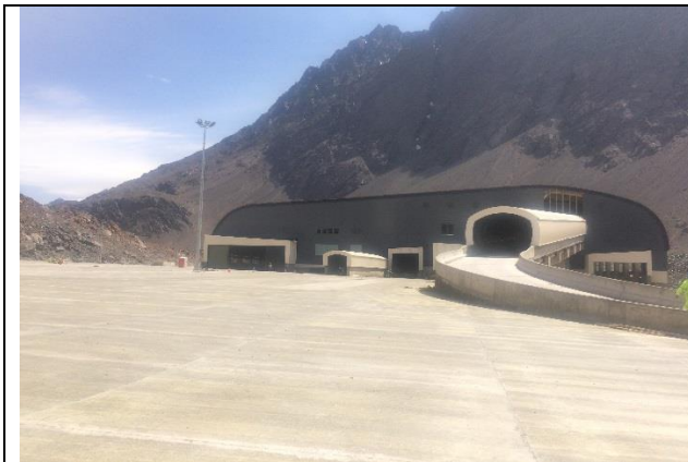
Edificio de Control y Servicios – Vista norte