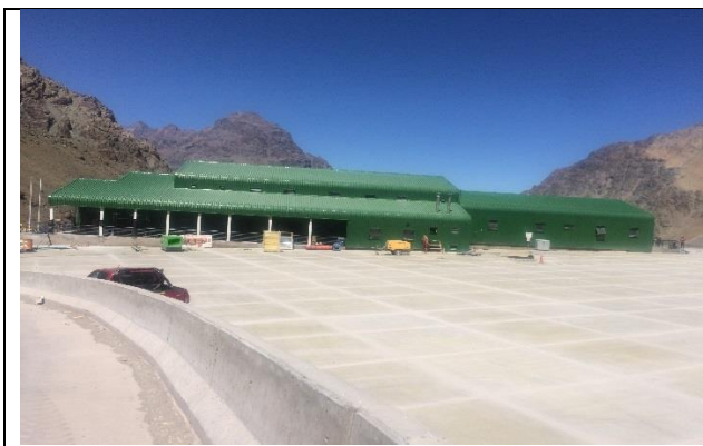
Edificio de Carabineros – Vista norte-sur