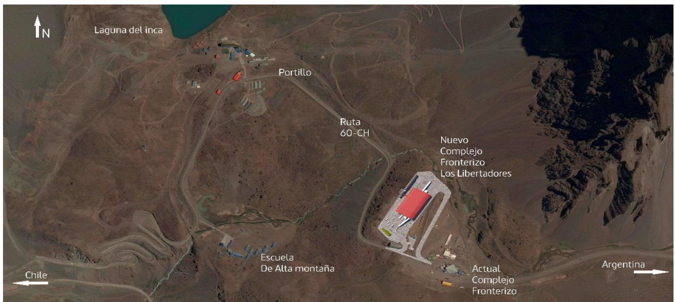
Planta de Emplazamiento del Nuevo Complejo Fronterizo