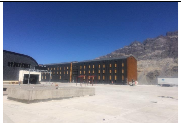
Edificio de Alojamiento – Vista norte-sur