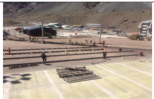
Trabajos en plataforma sur